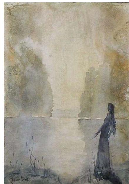
Juhana Siirto: Odottus