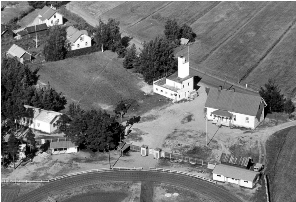
Kuvassa Honkalan aluetta ennen uudistuksia. Rakennukset oikealta järjestöalo Honkala, paloasema ja Musiikkimaja.