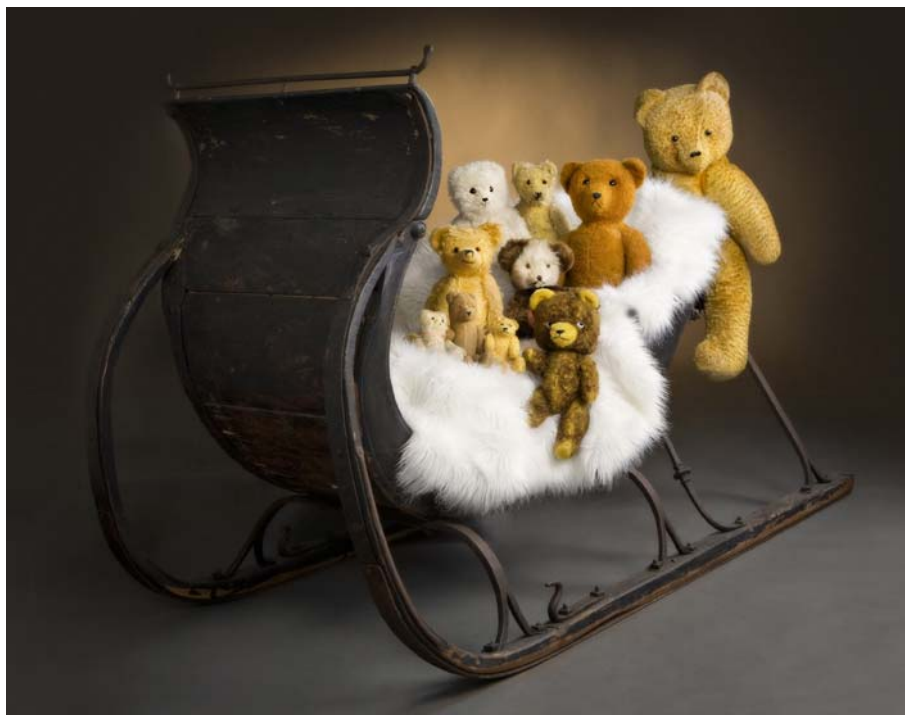
Kuva: Studio Heidi K