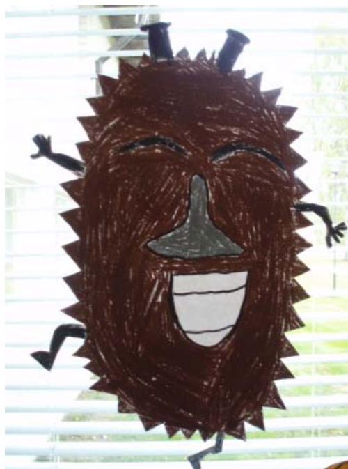
Haisulilla menee lujaa!

Lastenosaston syksyssä on lisäksi Harjavallan kakkosluokkalaisille pidetty kirjavinkkauksia niin kirjastossa kuin heidän omassa koulussakin.