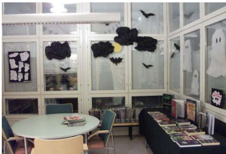
Kirjaston kauhunurkka eli Maagisen Pohjolan tunnelmia nuortenosastolla