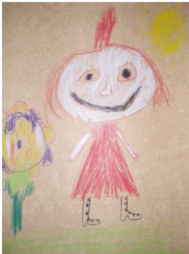
Muumilaaksossa asuu myös Pikku Myy