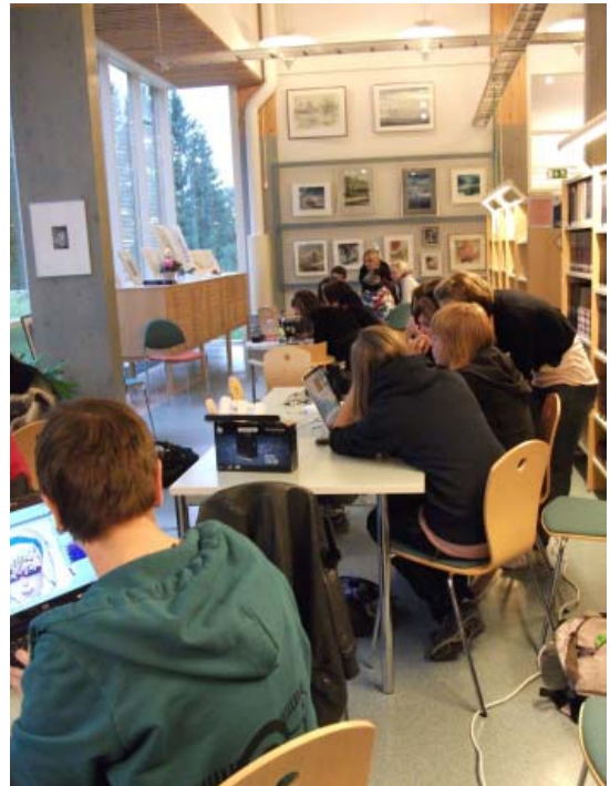
Mediatyöpajassa työstettiin omia videoita

Nuorten palveluja on pyritty kehittämään myös muilla tavoin. Kirjaston nuorten sivuja on syksyn kuluessa laajennettu ja kehitetty: kannattaa käydä kurkkaamassa esimerkiksi linkkivinkkejä, joihin on poimittu hauskoja ja hyödyllisiä nettisivuja sekä nuorille että heidän kasvattajilleen. Nuorten nurkasta löydät myös kirjavinkkejä. Uusimpana lisäyksenä sivuilta löytyy nyt kirjalistoja ja lukutarjottimia eri aiheista, kuten urheilusta, vampyyreistä ja historiallisista romaaneista. Nuorten kirjallisuutta on nostettu entistä enemmän esille myös kirjaston tiloissa: nuorten aikuisten hylly on laajentunut ja sieltä löytyy nyt entistä enemmän 16 -25-vuotiaille suunnattuja romaaneja, tietokirjoja,