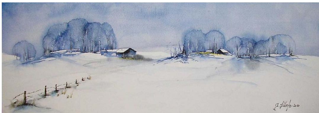
Juha Siirto: Sininen maisema