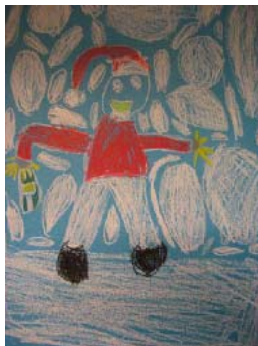
Voi tätä lumen paljoutta! Piirtänyt Aatu

Harjavallan kaupungin sähköpostipalvelin vaihdettiin viikonlopun (vko 48 29.-30.11.2008) aikana. Maanantaina 1.12.2008 otetaan uusi palvelin käyttöön. Sähköpostien vastaanotossa ja lähettämisessä tulee varmasti olemaan katkoksia viikonloppuna ja vielä seuraavalla viikollakin. Älkää siis luottako postien perille tuloon tai lähettämisen onnistumiseen ko. aikana. Tiedottakaa tästä myös yhteistyökumppaneillenne. Harjavallan kotisivuille tulee myös maininta mahdollisista katkoksista. Ottakaa talteen vanhoja postejanne mahdollisuuksien mukaan. Jos olette käyttäneet Outlookia tai Outlook Expressiä, niin vanhat postinne säilyvät omilla koneillanne ja ovat sieltä tarpeen mukaan siirrettävissä uuteen järjestelmään. Lisää ohjeita, mm. webmailin osoite ja kirjautumiskäytännöt, on vielä tulossa.