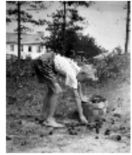
Nuori talkoolainen käpyjen keruussa v. 1943.

Sotakorvausteollisuuden kannalta oli tärkeää myös se, että Harjavaltaan siirretty Outokumpu Oy:n kuparitehdas saataisiin mahdollisimman nopeasti toimintaan. Tehtaan rakentaminen sujuikin vauhdilla. Purkutyöt Imatralla oli aloitettu heinäkuussa 1944, ja kuparin tuottaminen aloitettiin Harjavallassa tammi-kuussa 1945. Silloin tosin vasta tehtaan koneet olivat käyttökunnossa, rakennukset niiden ympärillä olivat keskeneräisiä. Samaan aikaan vierisellä tontilla valmisteltiin kuparitehtaan jätekaasuja hyödyntävän rikkihappotehtaan rakentamista.