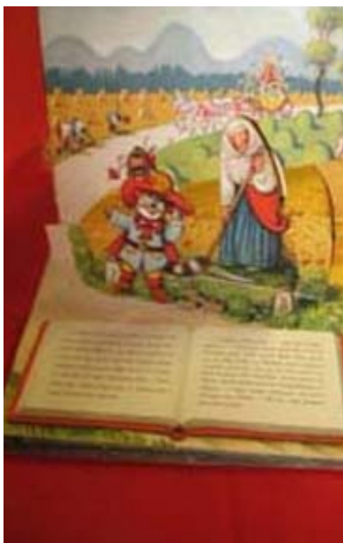
Teksti ja kuvat: SIRPA LEHTINEN

Nuorisokirjojen osastolle mentiin lastenkirja osaston ohi. Kun tulin kunnantalon alakerran rappusia kirjastoon, katsoin haikeana lastenkirjojen hyllyjä. Se aika oli jäänyt taakseni, että tuon pyöreän pöydän vieressä istuisin. Siinä olivat nyt uuden ikäluokan istujat. Haikeuttako tunsin sydämessä, kun astelin uusien kirjojen pariin? Näin sitä ”luopumista” tapahtuu - kirjastossakin.