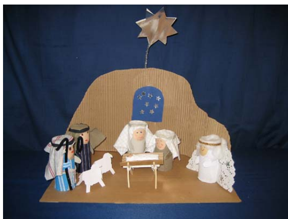
Pohjoisrannan päiväkodin Peukaloisten jouluseimi.