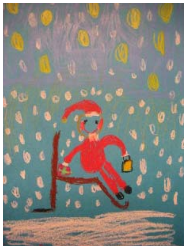
Kyllä välillä pitää levähtää! piirtänyt Ella-Sofia