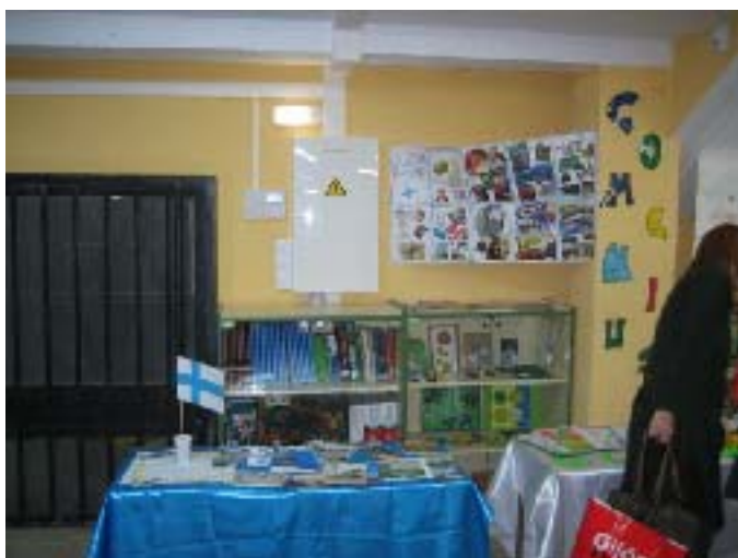
Suomi esillä Cabañaquintan Comenius-nurkkauksessa.