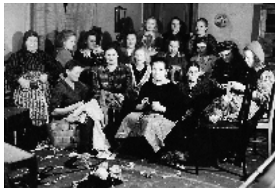
Naiset ovat kerääntyneet Kurrulle matonkuteita leikkaamaan v. 1948.

Muistelupiirin kokoontumiset jatkuvat tammikuussa 2009, ja niistä ilmoitetaan Sydän-Satakunta-lehden Seurat toimii -palstalla. Ensi vuonna jatkamme 1940-luvun muistojen parissa. Kaikki kotiseutunsa historiasta kiinnostuneet ovat tervetulleita mukaan – paikalla on aina myös meitä ”kuunteluoppilaita”, joilla ei ole omakohtaisia muistoja näistä ajoista.