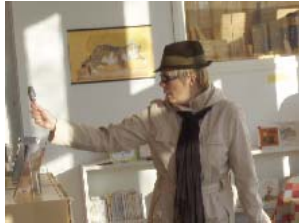
Agentti K etsii kirjastotyön johtolankoja.

Kirjastossa on syyskaudella tapahtunut jos jonkinlaisia seikkailua: isommat ovat ratkoneet tiedonhakuja tietokoneella ja pienemmät ovat etsineet johtolankoja kirjaston salaisuuksiin.