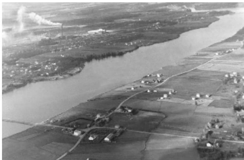
Harjavallan pellot ja metsät saivat keskelleen piiput 1940-luvulla, kun Outokumpu Oy:n kuparitehdas siirrettiin tänne sodan jaloista Imatralta.