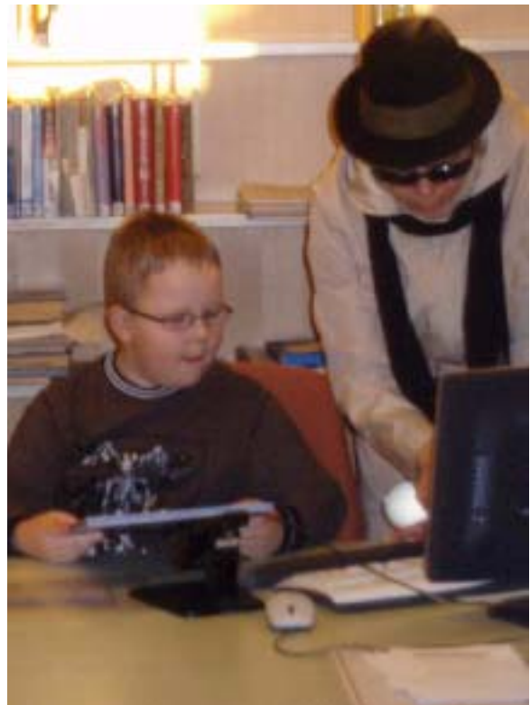
Punaisten säteiden salaisuus selviää...