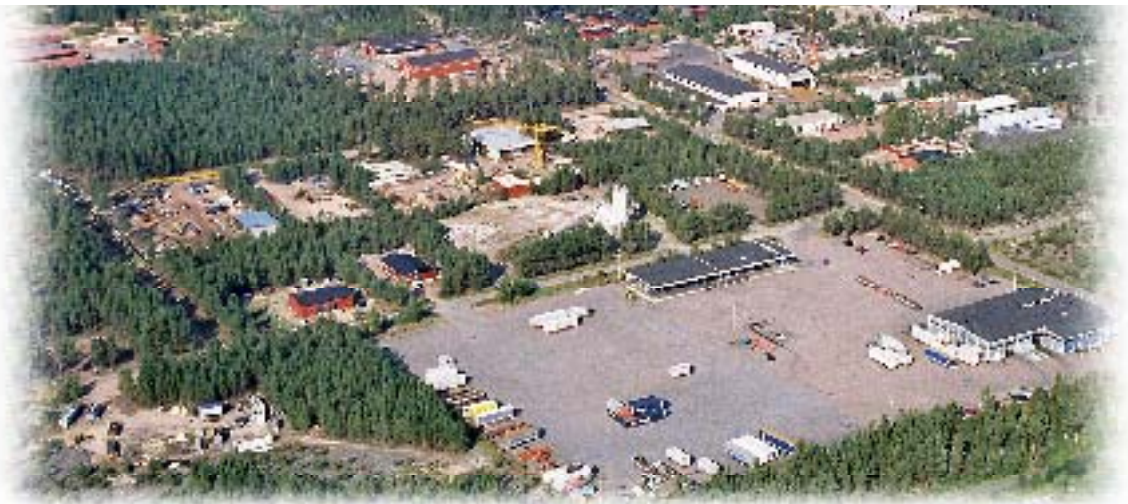
Kuva Sievarin teollisuusalueesta

Tänä vuonna kiinnostus on ollut poikkeuksellista, tontteja on varattu jo 10 kpl.