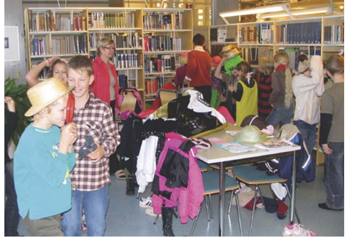
Keskustan koulun kolmosluokkalaisia valmistautumassa runoesitykseen kirjastossa.

Pirkkalan ja Keskustan koulujen iltapäiväkerhot ovat saaneet myös osansa kirjaston kulttuuritarjonnasta. Molemmissa iltapäiväkerhoryhmissä on nimittäin pidetty muutaman kerran kirjastotätien vetämä runoraati, jossa lapset ovat saaneet kuunnella ja arvostella runoja. Runoista on myös keskusteltu ja erilaisia runoja poh-