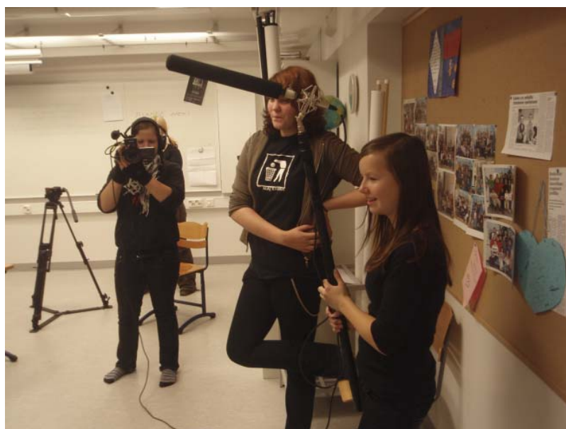
Nuoret pääsivät konkreettisesti kokeilemaan kuvaustekniikoita.