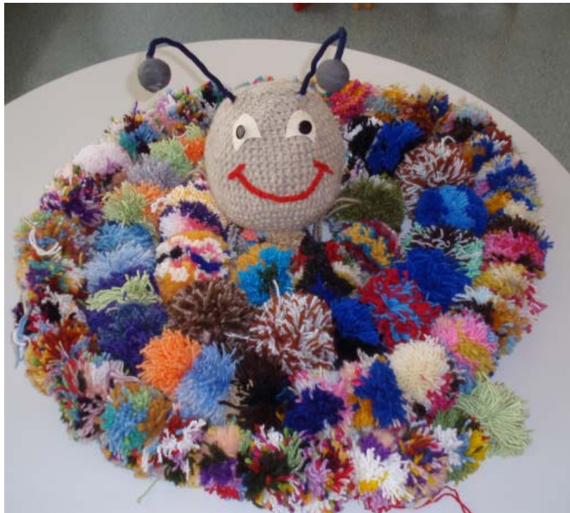
Elli Lukutoukka kodikkaasti kiepillä