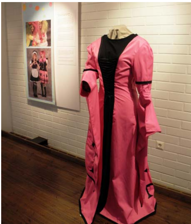
Kuvassa visual key-tyylinen cosplay-puku näyttelystä Fantasian matkalaiset - cosplay ja historian elävöitys.