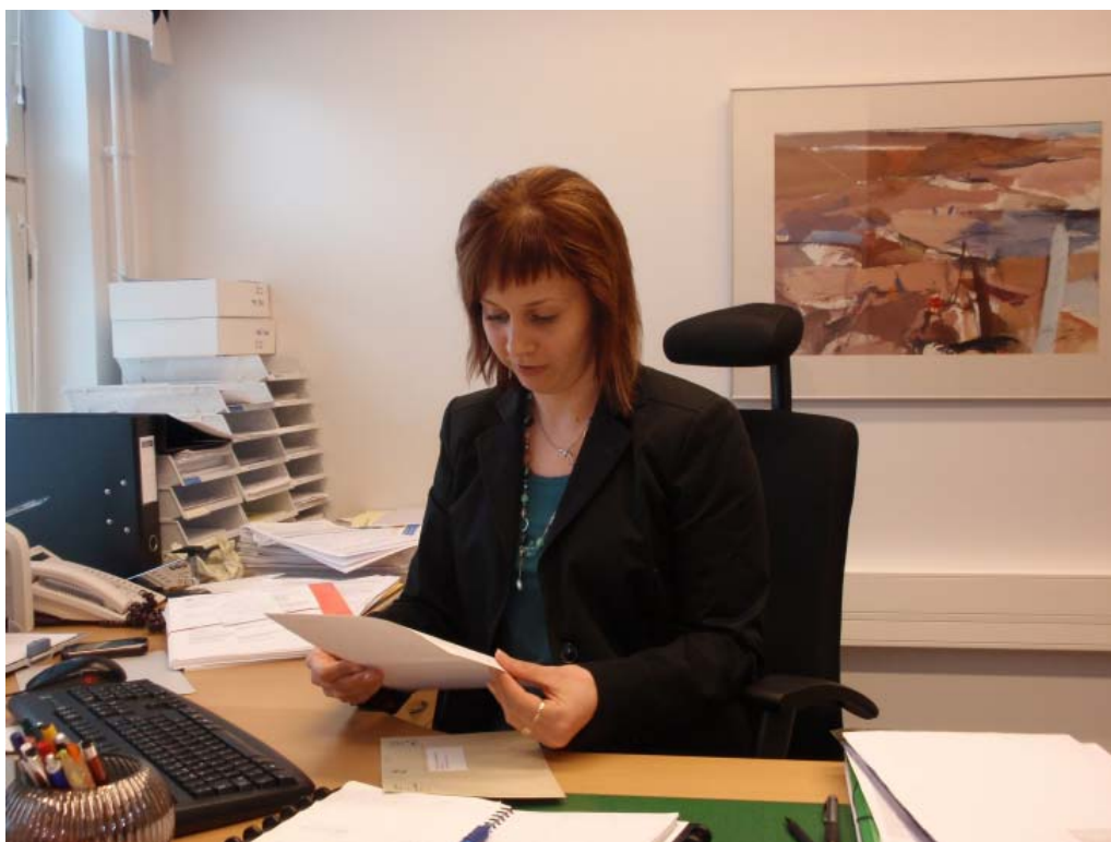
Yhteistyön merkitys korostuu kaikessa sosiaalityössä