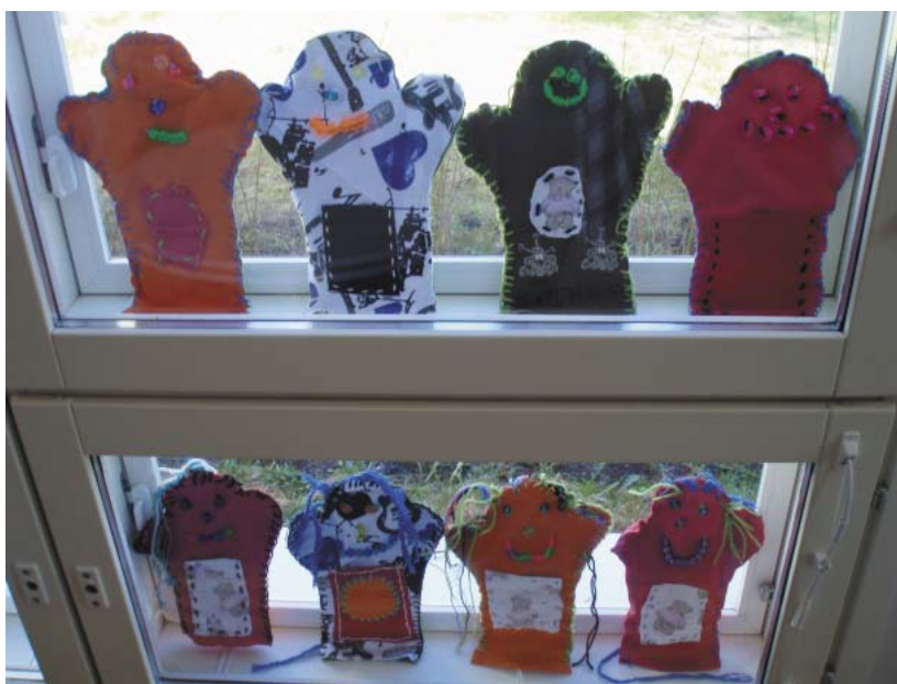
Keskustan ja Pirkkalan koulujen iltapäiväkerholaisten askartelemat peikkokäsinuket

Kilpailulomakkeita ja –sääntöjä voi noutaa kirjastosta 31.5. alkaen