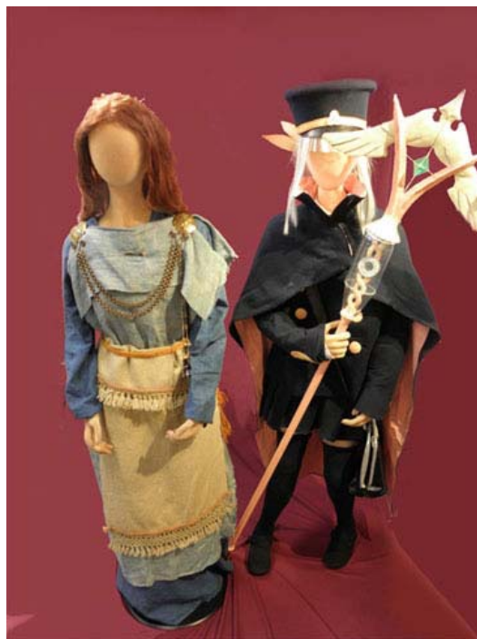
Vasemmalla rautakausin naisen puku, oikealla cosplay-puku, jonka esikuvahahmo on Fumika japanilaisesta anime- ja manga-sarjasta Shigofumi: Letters from the Departed .

Näyttely Fantasian matkalaiset – cosplay ja historian elävöitys esittelee kaksi pukeutumisen, jäljittelemisen